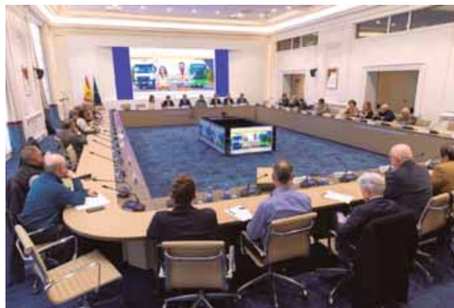
Los miembros del CNTC, en un momento de la presentación de la campaña audiovisual “La carretera siempre tiene salidas”

“Gidaririk gabe, ez dago garraiorik” txostenak ondorioztatzen du inkestatutako enpresen % 53k gidariak behar izan dituela azken urtean